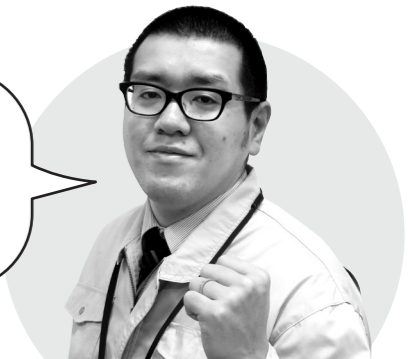
(公財)しまね農業振興公社 農地集積推進室 平塚主任主事

農地中間管理機構が貸し借りの間に入ることで、まとまった農地の借り入れや分散した農地の集約化、契約事務や賃料の支払事務の負担を軽減することができます。