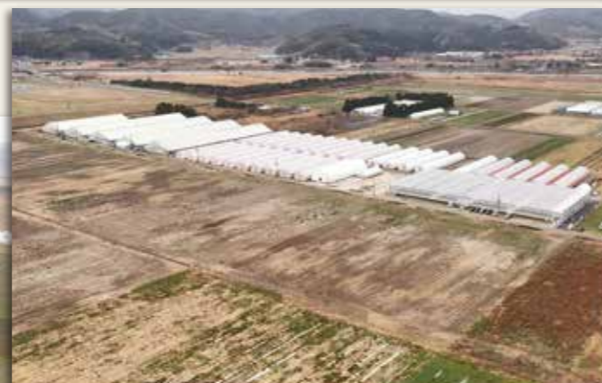
▲イチゴやトマトの観光農園にも取り組んでいる経営体